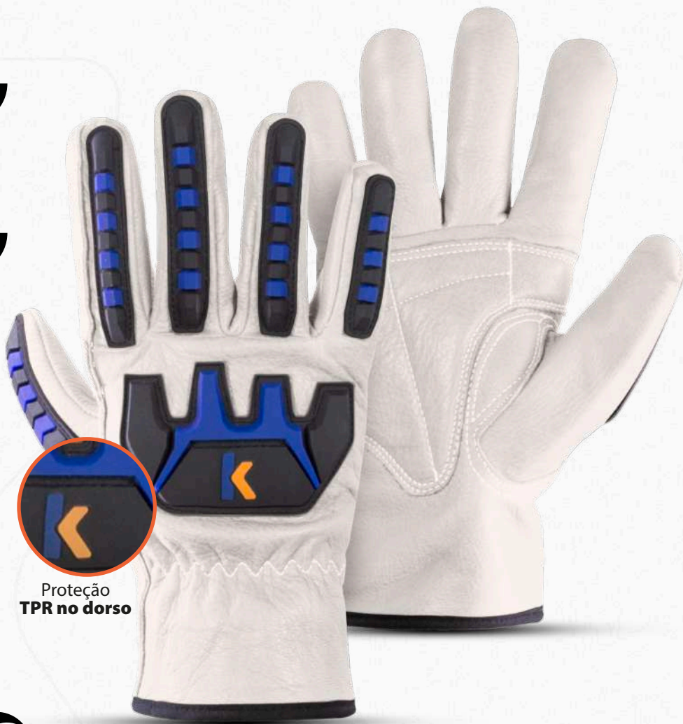
Proteção TPR no dorso