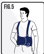
Puxe e una o extremo do lado direito sobre o lado esquerdo, coincidindo com o fechamento do velcro. Ajustando a cinta a sua medida.