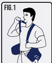
Abra a sua cinta ergonômica e coloque os suspensórios.