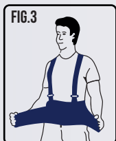
Pegue os dois extremos da cinta ergonômica para ajuste.