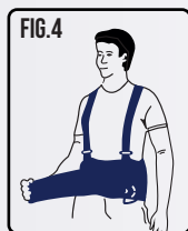
Puxe e una o extremo do lado esquerdo sobre o lado direito.