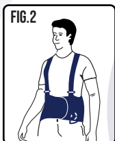
Ajuste a cinta ergonômica entre o quadril e a costela.