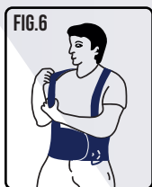
Ajuste os suspensórios e a tensão da cinta à sua medida.