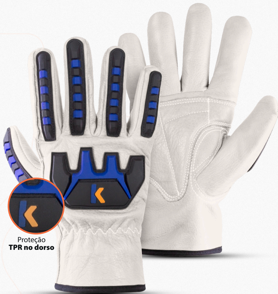
Proteção TPR no dorso